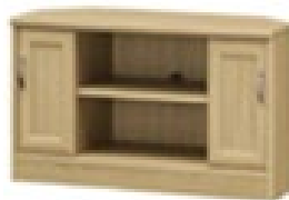
<コーナーローボード> ナチュラルまたはブラウン