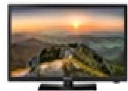
<ハイセンス24型> 地上・BS・110度CSチューナー内蔵 ハイビジョン液晶テレビ