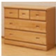
<1050ローチェスト> ナチュラルまたはブラウン