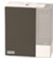
<ハイブリッド式加湿器>